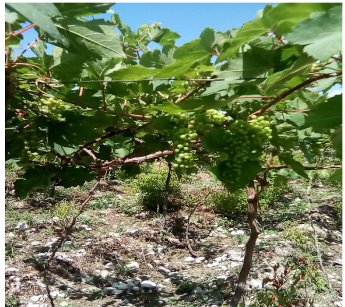
Evidencias de las nuevas plantaciones de las variedades de uvas Red Globe y Tempranillo en los Municipios de Los Ríos, Neyba y Galván.