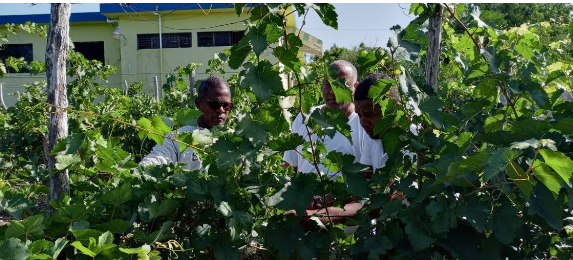
Plantaciones nuevas de la variedad Tempranillo plantadas en el mes de marzo 2022.